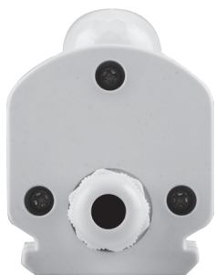
Вид с торца светильника